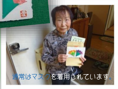
通常はマスクを着用されています。