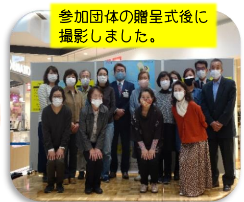
参加団体の贈呈式後に撮影しました。