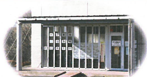
自然学習館内（元農協直売所）