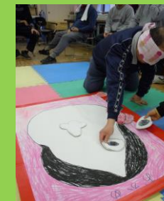
みんなで綱引きや福笑い (余暇活動の1コマ)