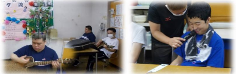
「七夕様」をギター演奏で唄いました